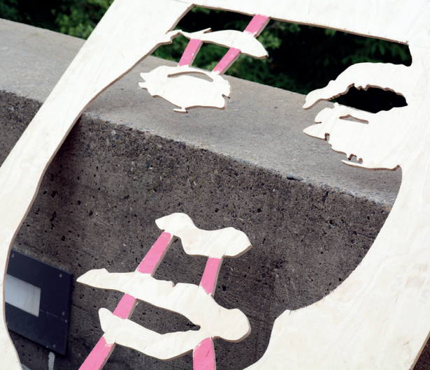
Eine der Schablonen, Foto: Cäcilia Then

Moos, Flechten oder Schmutzpartikel aus der Atmosphäre bedeckten Fläche. Diese wird mit einem Hochdruckreiniger oder einer Drahtbürste gezielt von seiner Schmutzpatina befreit. Als „Reinigungsfläche“ dienen hierfür vom Künstler erstellte Schablonen, deren Negativ für die Abtragungsfläche offenbleibt. So entsteht im Endeffekt ein Schwarz-Weiß-Bild, das sich aus der dunklen, verschmutzten Patina und der hellen, gereinigten Fläche ergibt. Die Natur holt sich jedoch zurück, was ihr durch den Abtragungsprozess genommen wurde. Die hellen Flächen werden allmählich dunkler, bis sie irgendwann vollends wieder mit der schmutzigen Patina verschmelzen. Damit werden die Gesichter auf der Unteren Brücke in ein paar Jahren wieder verschwunden sein. Womit sich symbolisch die Vergänglichkeit der Kunst mit der Vergänglichkeit des Menschen vermischt. Ein ganz natürlicher Kreislauf, der an dem Punkt endet, an dem er begann. Eine „schöne, dreckige Patina“, freut sich Klaus Dauven. Diese ist und bleibt nun mal die Grundlage seines künstlerischen Schaffens. Und diese wird es immer irgendwo im öffentlichen Raum geben. So kann die Kunst unablässig neu aufleben, bleibt damit am Puls der Zeit und am Puls der Jugend. Eine frische, stets an aktuelle Zeitthemen angelehnte Kunst, die die Kultur und Menschen wiederbelebt. „Ich finde den Aspekt der Zeitlichkeit und dass es wieder verschwindet